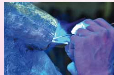
Travail en fonderie de « Supplique » © G. Klein

Square du Chevalier-de-Saint-George • 18 h